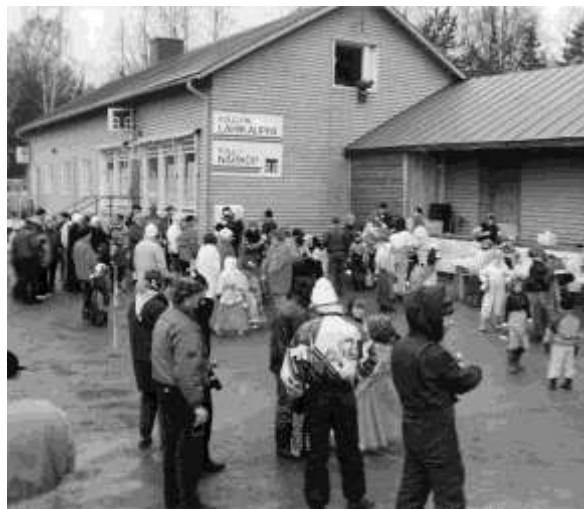
Påskhäxsamling vid butiken år 1991

Vår kära allmogeförening är viktig för bysamhället, låt oss värna om den! Barn- och ungdomsverksamheten liksom de vuxnas gemenskap är något vi vill bevara även för kommande generationer av Kullobor.